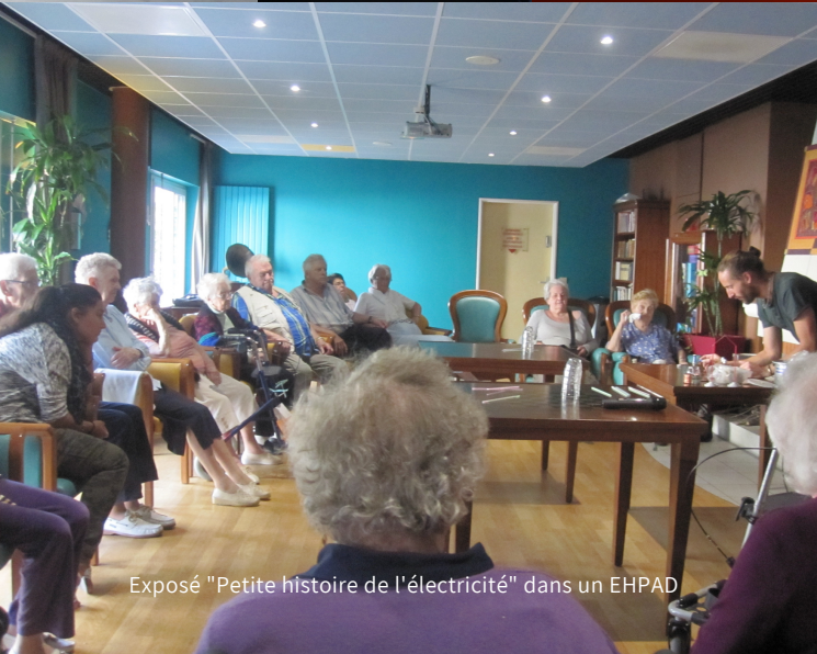
Exposé "Petite histoire de l'électricité" dans un EHPAD