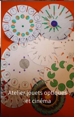
Atelier jouets optiques et cinéma