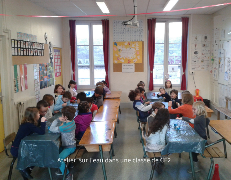
Atelier sur l'eau dans une classe de CE2